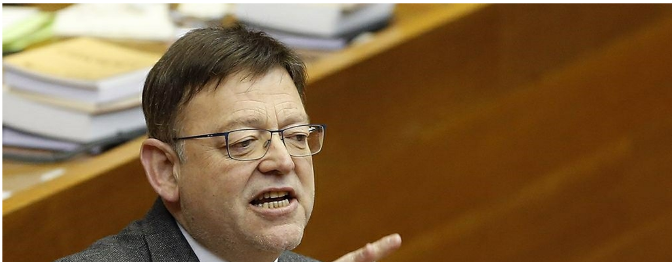
El president de la Generalitat, Ximo Puig