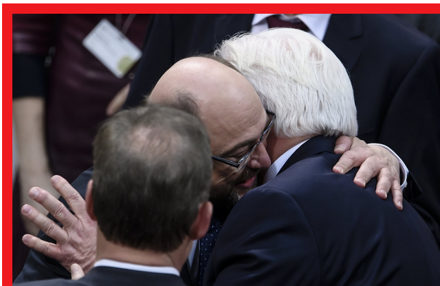
Martin Schulz abraza a Frank-Walter Steinmeier, elegido presidente de Alemania

En un momento de incertidumbres y riesgos dentro y fuera del país, en su discurso de aceptación del cargo destacó que Alemania se ha convertido para muchos en un "ancla de esperanza" y pidió valor para preservar "la libertad y la democracia en una Europa unida". Frente a Steinmeier había otros cuatro