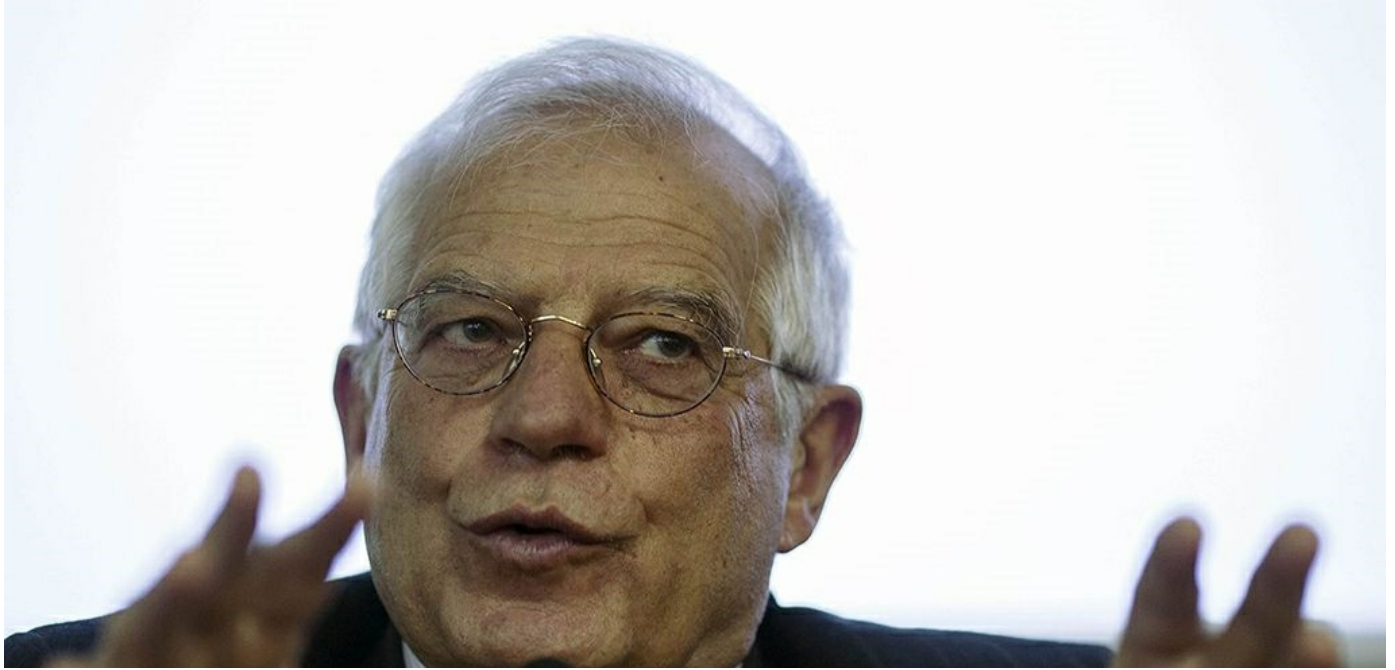
El expresidente del Parlamento Europeo y exministro socialista Josep Borrell