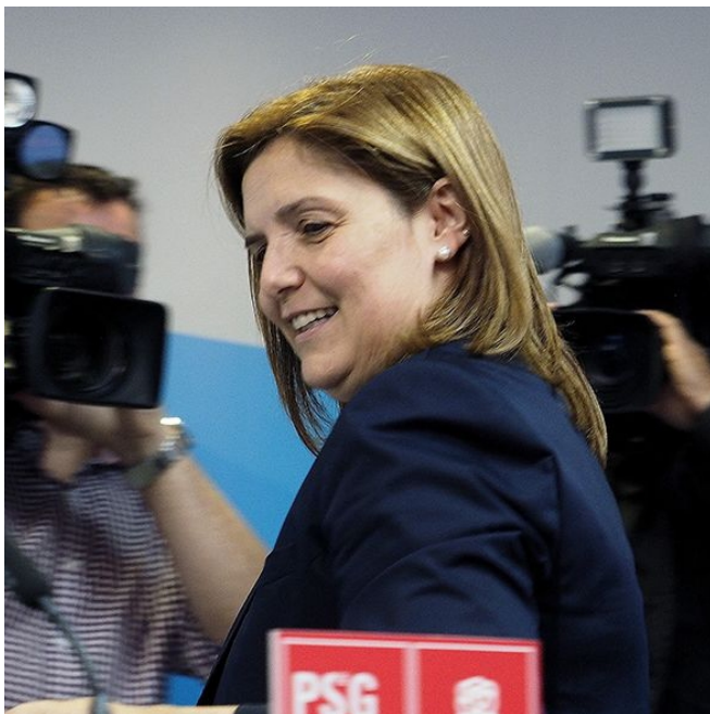
La socialista Pilar Cancela