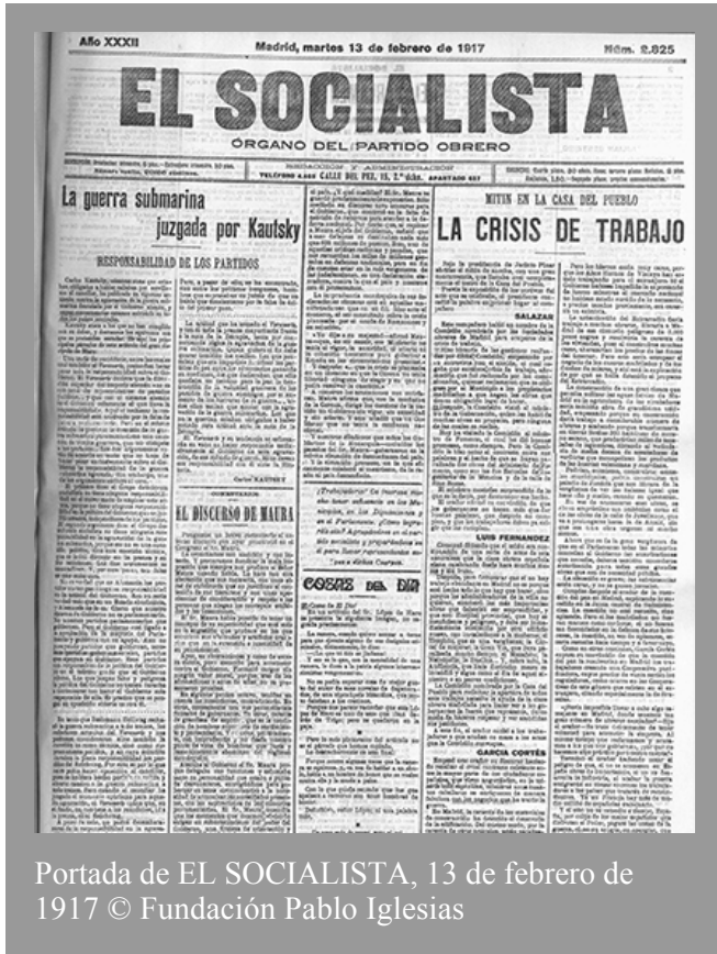
Portada de EL SOCIALISTA, 13 de febrero de 1917

Carlos Kautsky, mientras otros que estaban obligados a hablar callaban por servilismo al canciller, ha publicado un vigoroso artículo contra la agravación de la guerra submarina decretada por el Gobierno alemán, y cuyas consecuencias estamos sufriendo en todos los países neutrales. Kautsky ataca a los que no han cumplido con su deber, y desvanece los equívocos con que se pretenden escudar. He aquí los principales párrafos de este artículo del gran discípulo de Marx: Una serie de periódicos, entre los cuales también el Vorwaerts, pretenden hacer pesar toda la responsabilidad...