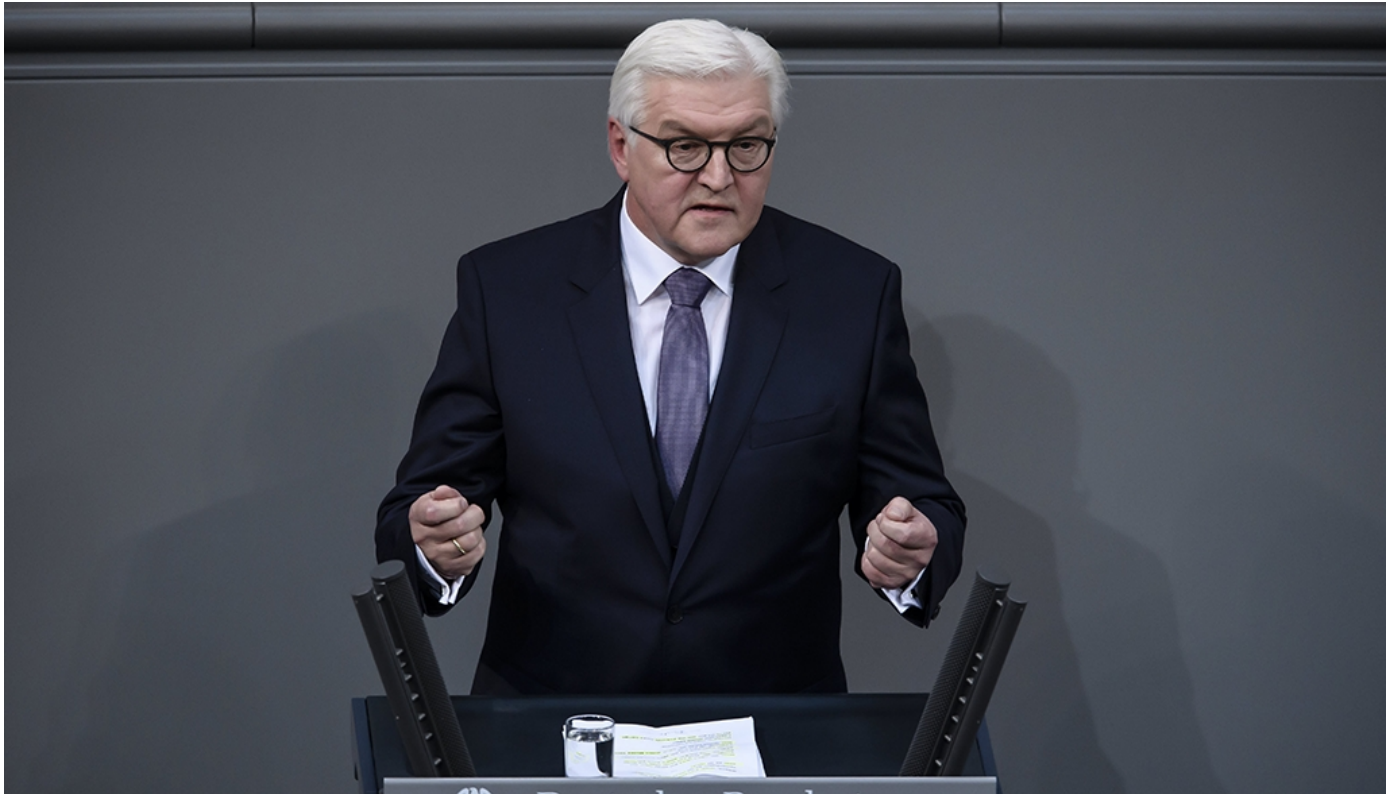
El socialdemócrata Frank-Walter Steinmeier

El socialdemócrata Frank-Walter Steinmeier, exministro de Asuntos Exteriores y candidato de la gran coalición de gobierno en Alemania, fue elegido ayer presidente del país por mayoría absoluta en la Asamblea Federal, ante la que pidió "valor" para defender la democracia en tiempos difíciles.