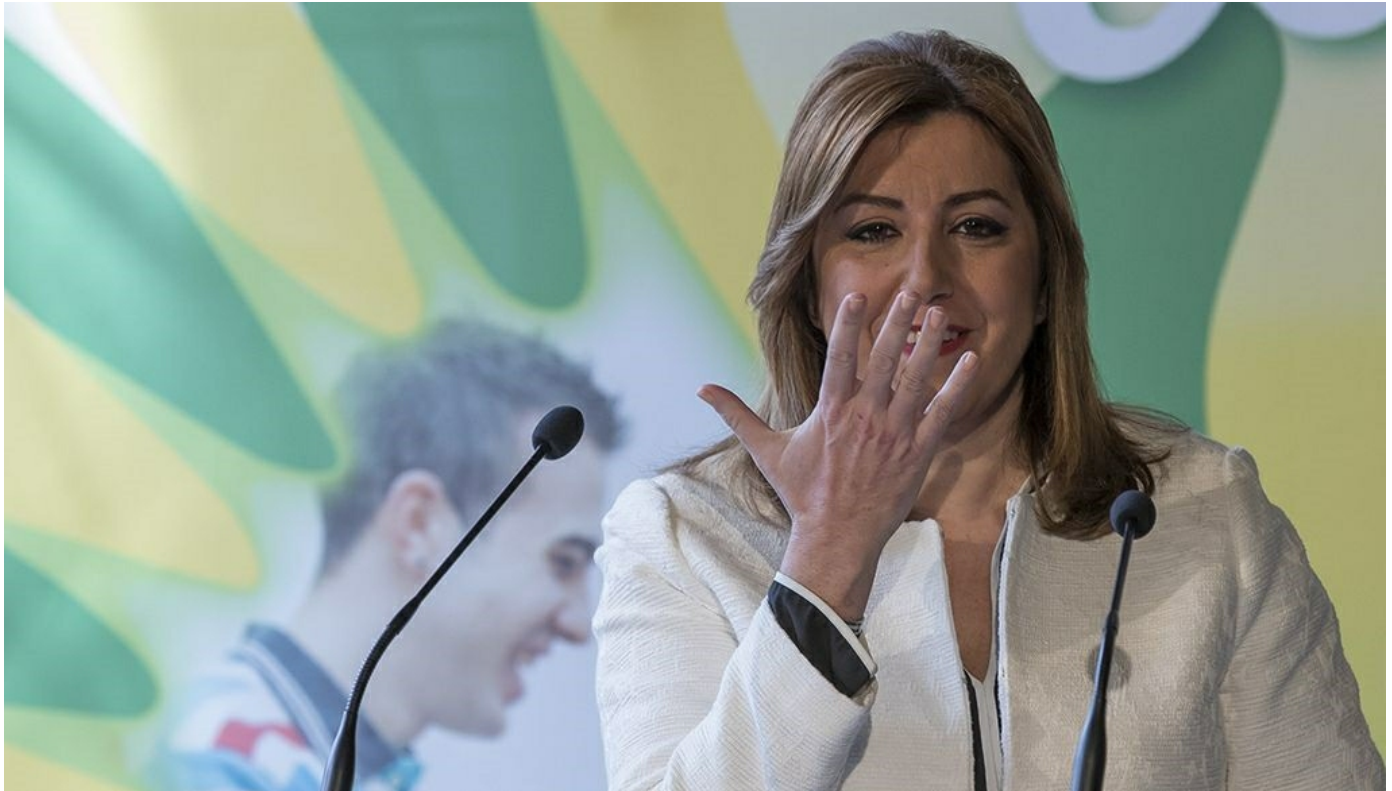
La presidenta andaluza, Susana Díaz, utiliza el lenguaje de signos

La presidenta de la Junta, Susana Díaz, ha destacado que el Gobierno andaluz va a "seguir invirtiendo y teniendo sensibilidad" para que todas las personas "lleguen al límite de sus capacidades en igualdad de oportunidades". Así se ha pronunciado durante el acto que ha presidido en San Telmo de celebración del X Aniversario de la Fundación ONCE de Atención a Personas con Sordoceguera (FOAPS).